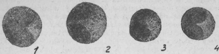
Рис. Fig. 1. Salmo salar L. Клетка лимфо-миэлобластического типа. Eine Zelle von lympho-myeloblastischem Typus.