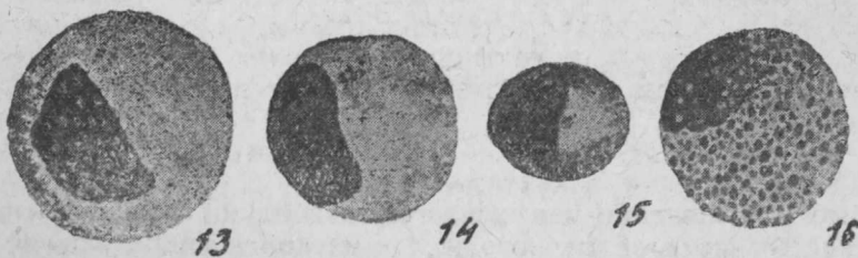
Рис. Fig. 13. Cyprinus carpio L. Моноцит. Ein Monozyt.