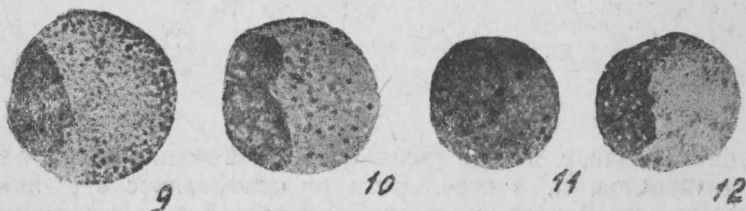
Рис. Fig. 9, 10, 11. Cyprinus carpio L. Нейтрофилы, Neutrophilellen.