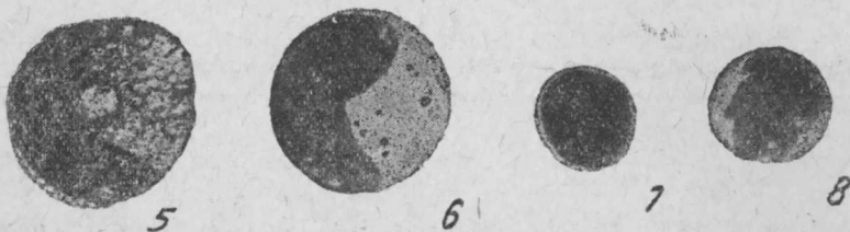
Рис. Fig. 5. Salmo trutta L. Клетка лимфо-миэлобластического типа. Eine Zelle von lympho-myeloblastischem Typus.