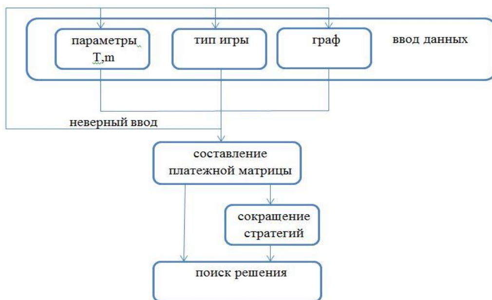
Рис 3.10.1. Схема работы приложения

Схема работы приложения с момента ввода данных до поиска решения изображена на рис. 3.10.1